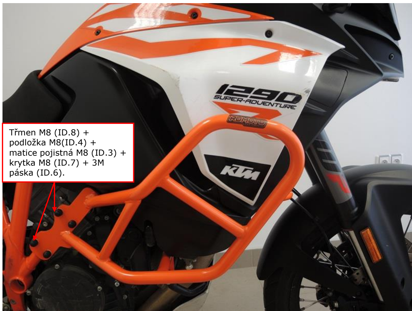
Třmen M8 (ID.8) + podložka M8(ID.4) + matice pojistná M8 (ID.3) + krytka M8 (ID.7) + 3M páska (ID.6).