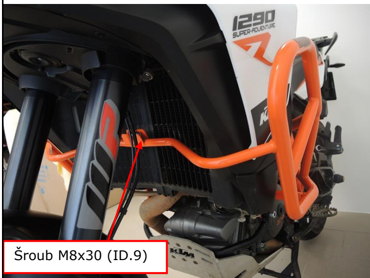
Šroub M8x30 (ID.9)